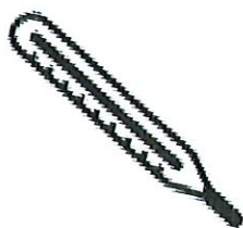
Fièvre > 38°C